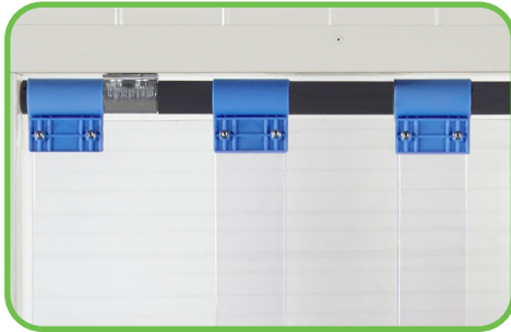
Abb. 1: Streifenvorhang Typ SE