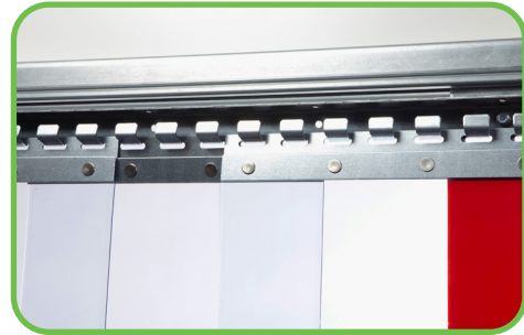
Abb. 2: Streifenvorhang Typ EH